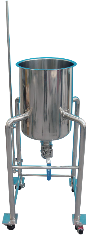
攪拌機用支柱を取付け

内溶液の粘度、攪拌目的、容量に応じて、タンクと攪拌機をセットした攪拌タンクを提供します。