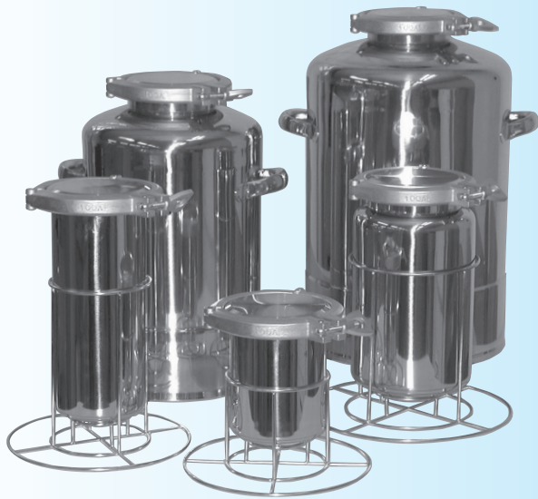
写真のラボボトルスタンドは別売りです。

容 量 ■ 1L ~ 30L 材 質 ■ SUS304 / SUS316L ガスケット ■ バイトン等 仕 上 ■ パフ研磨 使用圧力 ■ 0.4 MPa 以下 安全弁設定圧 ■ 0.5 MPa